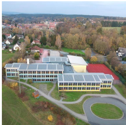
Grundschule Thurnau Kontakt zu allen Schulen im Landkreis Kulmbach

Klinikinterner KITA: 0-16 Lebensjahr 12 Plätze Reha 16 Plätze Jugendhilfe