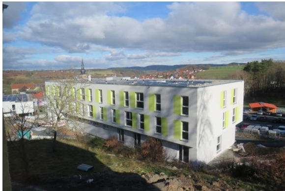
Mutter-Kind Haus: Rückenwind